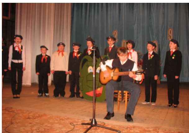
Юные пионеры на районном слете детских общественных организаций.