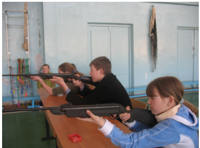
7 класс на «Метком стрелке».