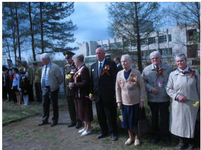
Автопробег по местам боевой славы.