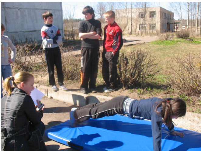
6 класс на этапе «Сильные, ловкие, смелые».