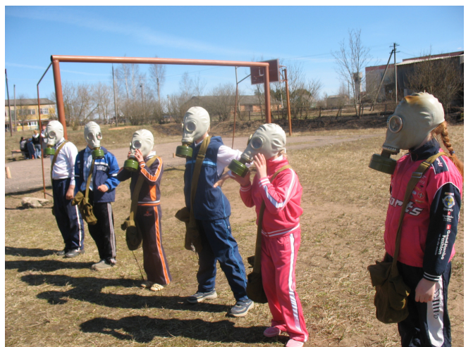
4 класс на этапе «Защита»