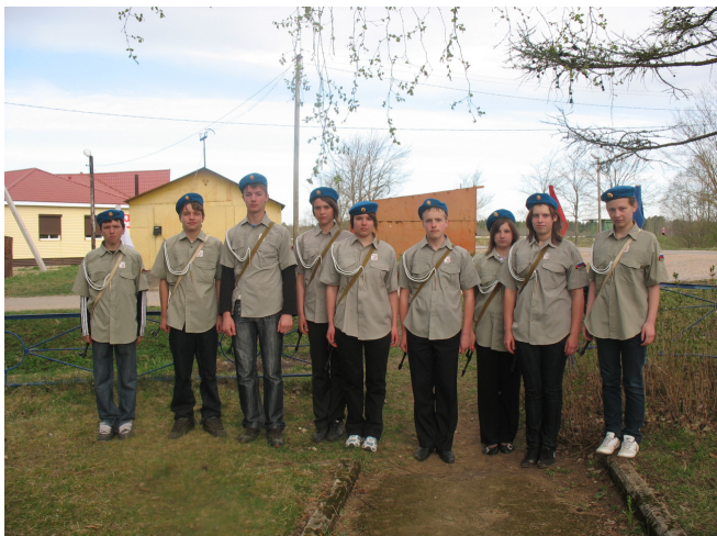
Группа почетного караула.