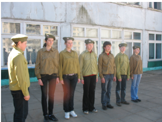
8 класс на «Смотре строя и песни».