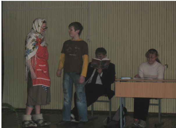
«Как должны помогать родители детям при выполнении домашнего задания» — рассказ 8 класса.