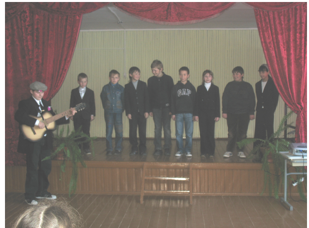
Пятиклассники исполняют частушки.