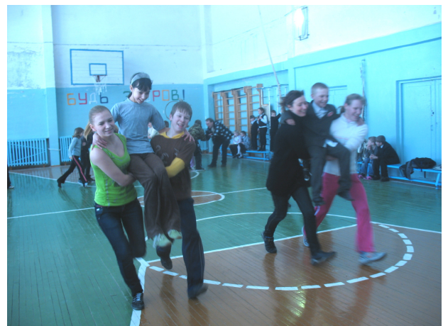
Участники акции «Будь Здоров».