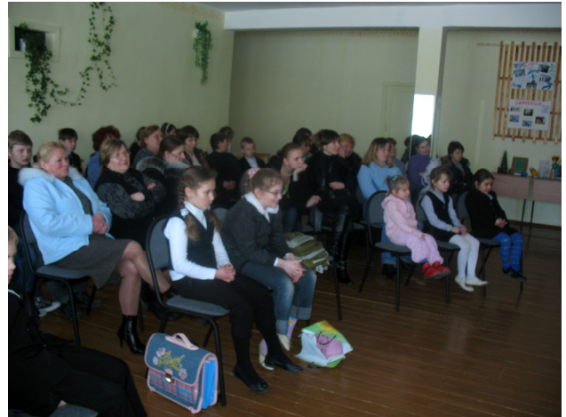
Родители в актовом зале школы.