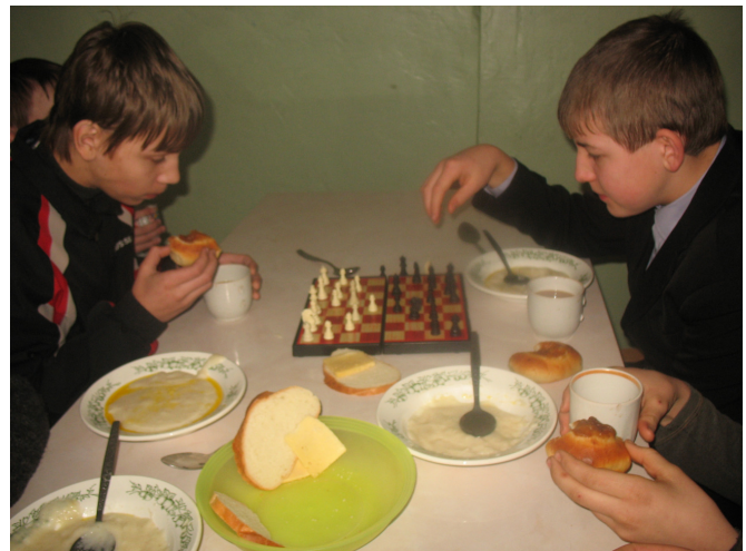
Полезное и приятное «в одном флаконе»