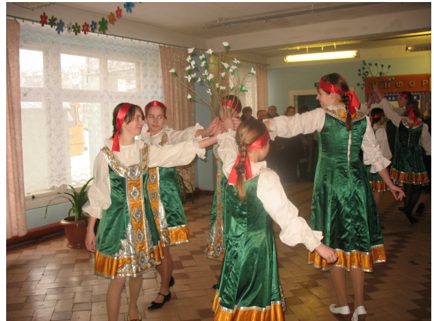
Все участники семинара директоров заявили, что наши девочки самые красивые.