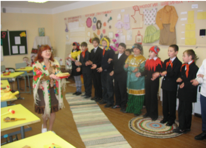
Пятиклассники—мастера устраивать праздники. В рождественские дни они с колядками прошли по всей школе, а здесь встречают масленицу.