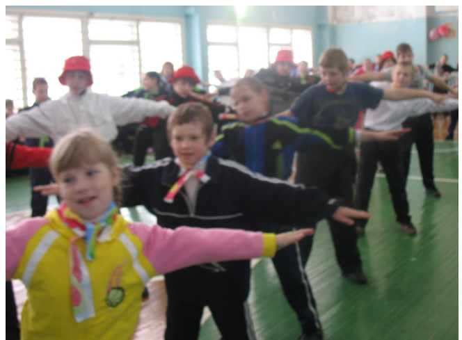
День Здоровья «БУДЬ ЗДОРОВ!!!»