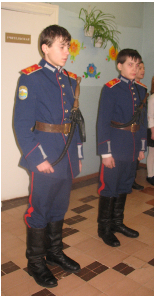
Бравые казаки поразили всех своей статью и выправкой